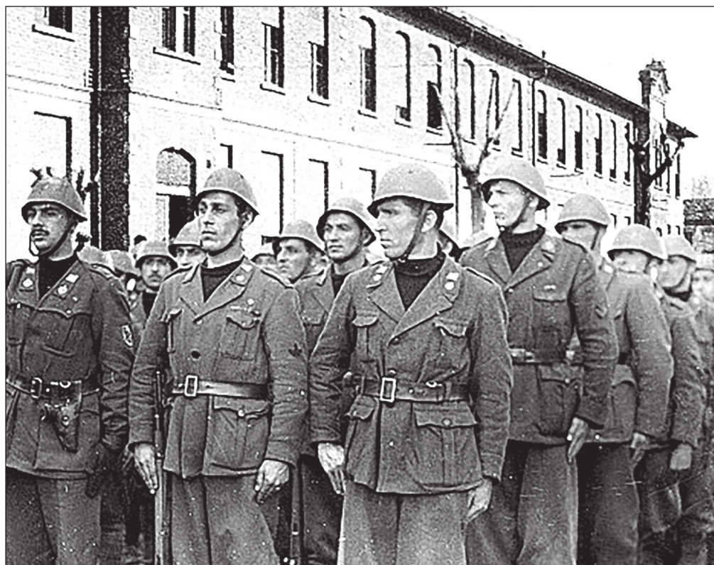
Militari della San Marco schierati davanti alla scuola di via Morzenti

gelo Lodigiano vi era un magazzino della Divisione S. Marco e che alcuni militari traevano profitto vendendo di nascosto, in modo illecito, coperte e altro materiale, e prevedendo l'arrivo di un inverno durissimo, pensò di compiere un'incursione per sottrarre il maggior quantitativo possibile di vestiario. Il tragitto era però pericoloso: presidii tedeschi, l'attraversamento del fiume Po, un campo tedesco lungo la strada presso la cascina Porchirola di Graffignana e le robuste cancellate del magazzino rappresentavano ostacoli concreti.