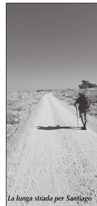
La lunga strada per Santiago