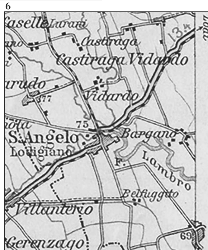
Immagine 1 - 1865 Galleria delle Carte geografiche Immagine 2 - XVI sec. Carte militaire du mojen age Immagine 3 - 1632 Cappuccini Immagine 4 - 1654 Principato di Pavia Immagine 5 - 1753 Catasto Teresiano: Contado di mezzo Immagine 6 - 1908 Carta d'Italia del Touring Club Italiano

centri: a sud Pavia, Corteolona, S. Colombano, mentre a nord Lodi, Milano, Landriano. Questa configurazione rimane inalterata sino ai primi anni del Novecento come indicato in una carta stradale del Touring Club Italiano 1908 dove viene evidenziato il tracciato della SS.235 che attraversava tutto il centro abitato. (immagine 6)