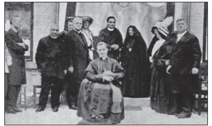
Sopra, l'ultima fotografia di Madre Cabrini, scattata il 4 luglio 1914 in occasione della fondazione di un orfanotrofo a Dobbs Ferry (Stato di New York), in primo piano il cardinale Bonzano. A sinistra, don Nicola De Martino, in primo piano in una foto di Patellani del 1946, conversa con alcune donne del quartiere davanti alla casa natale di Madre Cabrini,

Interessante la conclusione del brano che rasenta l'attualità: «Difficoltà, difficoltà - scriveva la Santa -: cosa sono le difficoltà? Scherzi da fanciulli ingranditi dalla nostra fantasia, fantasmi notturni delle anime renitenti a collaborare coll'onnipotenza di Dio. È bene meditare queste vigorose e sofferite parole, di colei che nella sua prodigiosa vita ne ha sperimentato tutta la verità; per noi