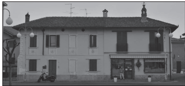
Il comignolo è collocato sul tetto dell'edificio che si trova in Largo Cairoli, proprio in fondo a viale Partigiani.